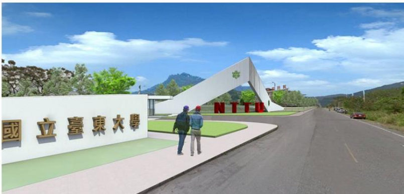
校門口區入口改善後示意圖