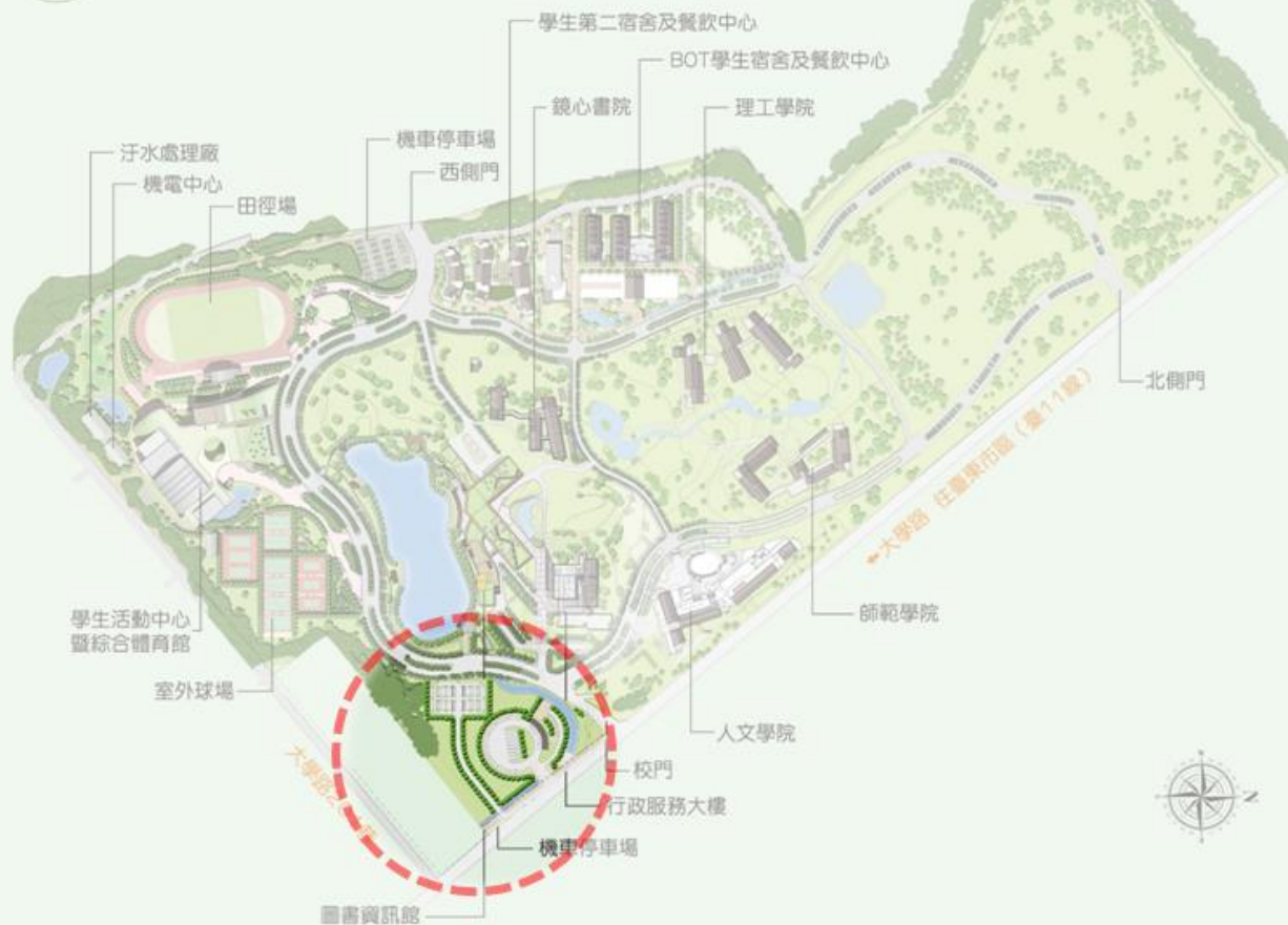
方案二：機車棚新建