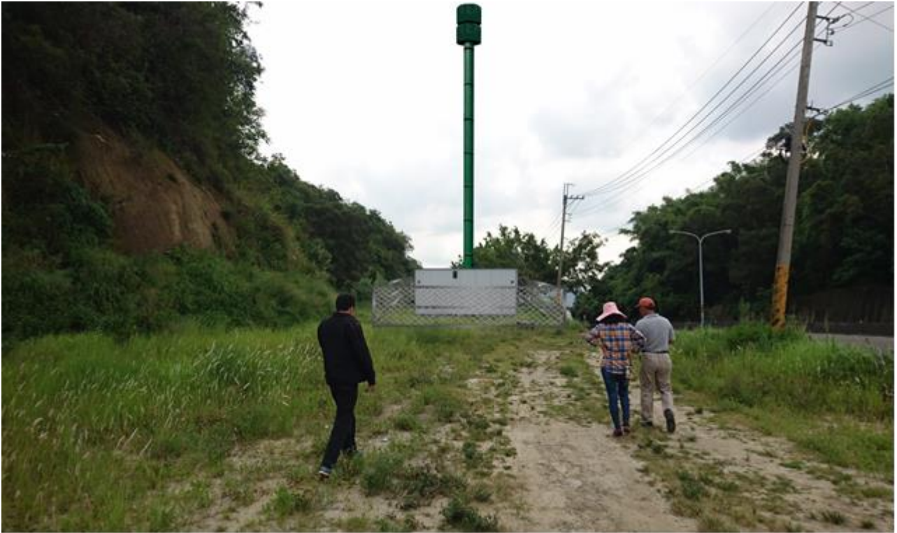
共構共站行動通訊平臺基礎設施模擬圖